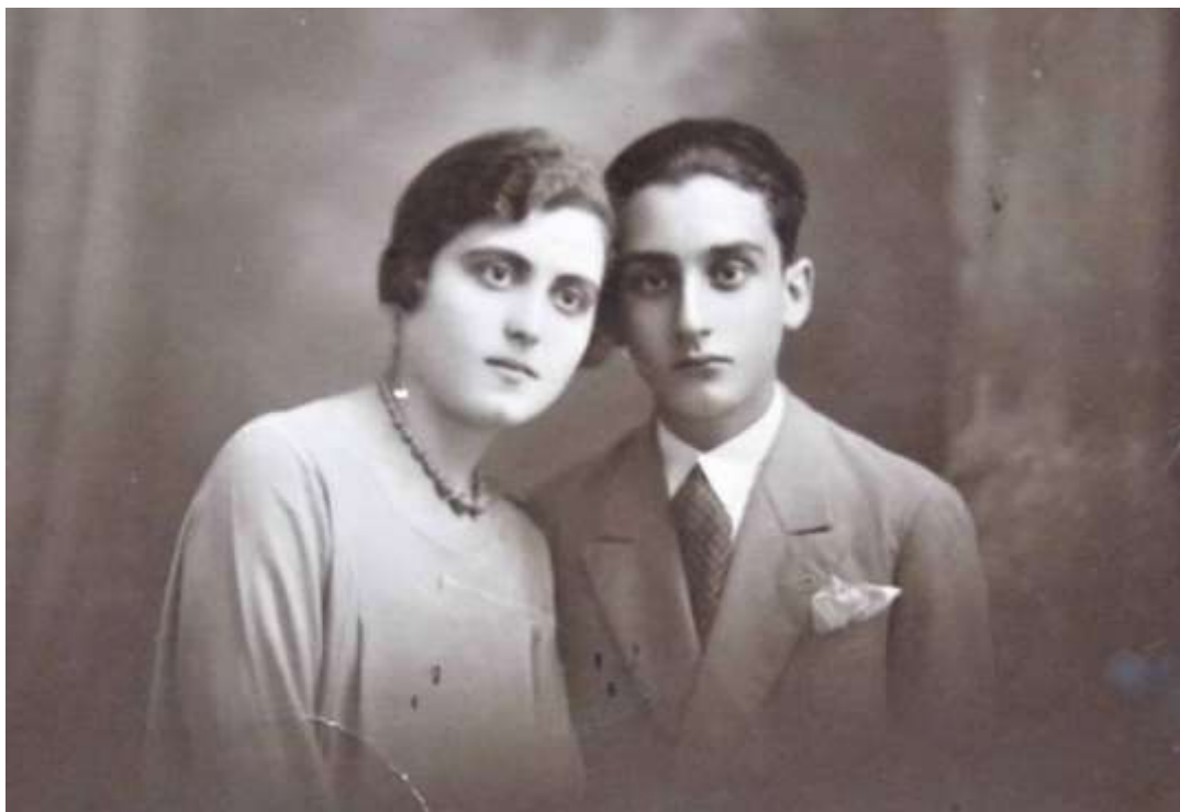
Due giovanissimi spos rossanesii