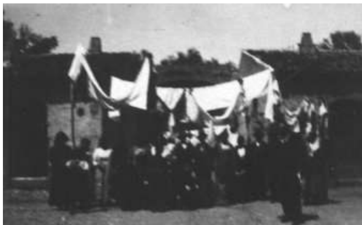
Gli "archi" per un matrimonio in campagna (S.Isidoro, primi del '900)