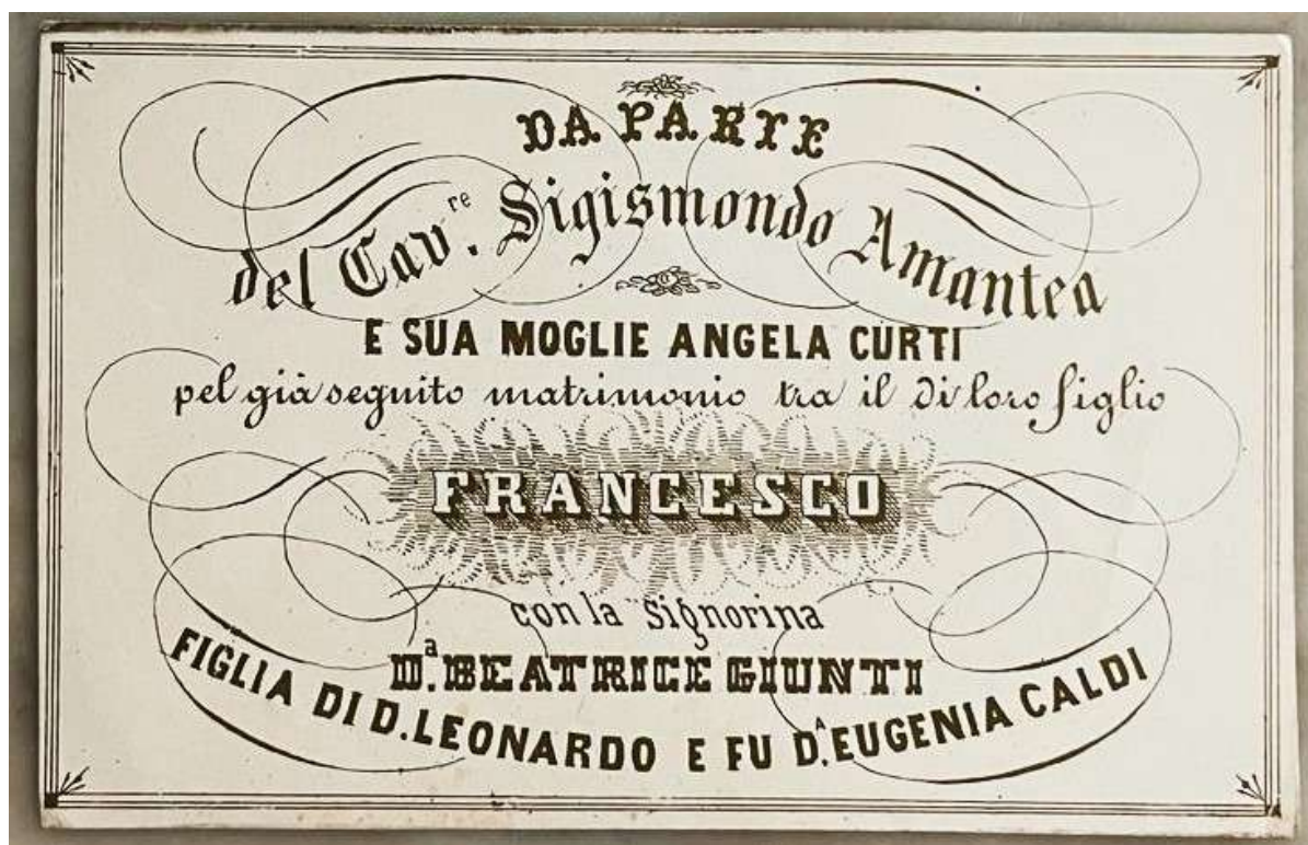
Partecipazioni di matrimonio famiglie Amantea e Giunti