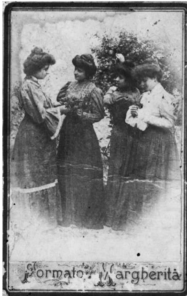
Rossano, primi del 900: Quattro ragazze in età da marito