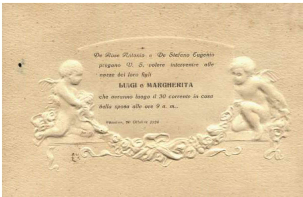
Una bella partecipazione matrimoniale degli anni 20 del 900