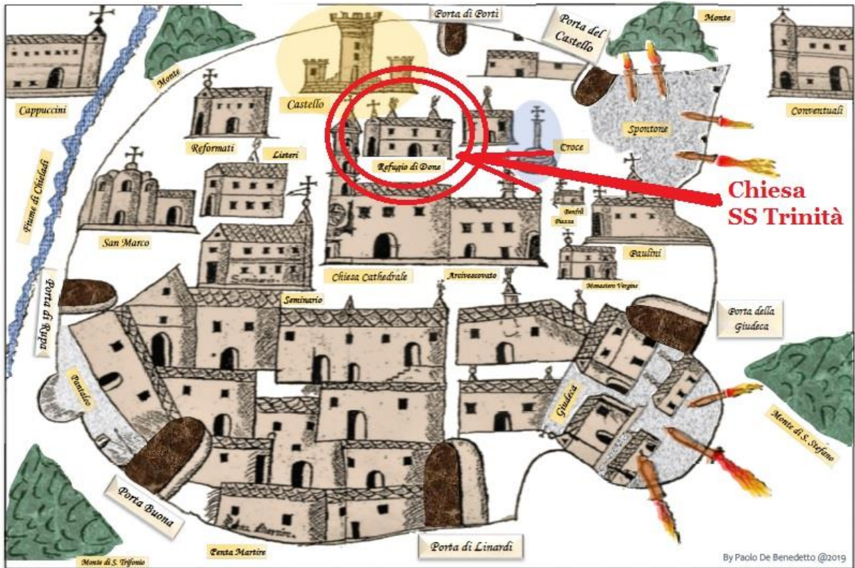
Antica Mappa Archivio Aldobrandini * Rossano XVII sec. (A.D. 1612) – Porte e Mappa della Città

un «Santo Monte della Pietà» dove «si prestano denaro sopra i pegni dei cittadini, a quali si dona quella somma di che il pegno stimerassi al doppio valevole».