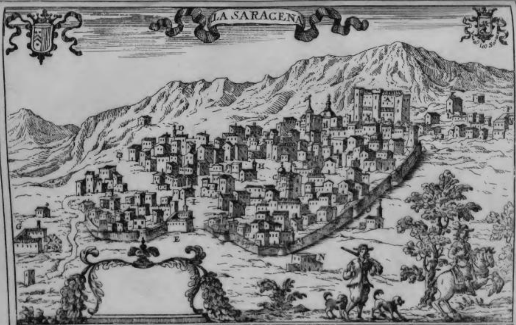
A. Castello. B. Paroc. di S. Leone. C. Paroc. di S. M. di Gambio. D. Paroc. di S. M. dell'Armo. E. Mon. di S. Teresa. F. S. Domenico. G. Capucina. H. S. Annâ. I. S. M. degl'Angeli. K. Casino del S. Duc. L. Psichier. M. S. Lorég. N. S. Nicolâ. O. S. Trucid.