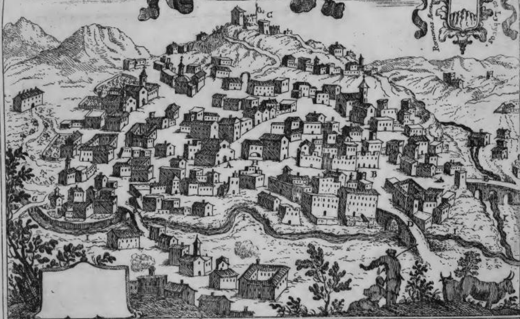
A. Il Duomo. B. Piazza maggiore. C. Castello. D. Ponte maggiore. E. Ponte delli Riucani. F. Ponte, e Borgo delli pignatari. G. Ponte dell'Arena. H. Soggiode Nobili. I. Fiume Crati. K. Fiume Busento