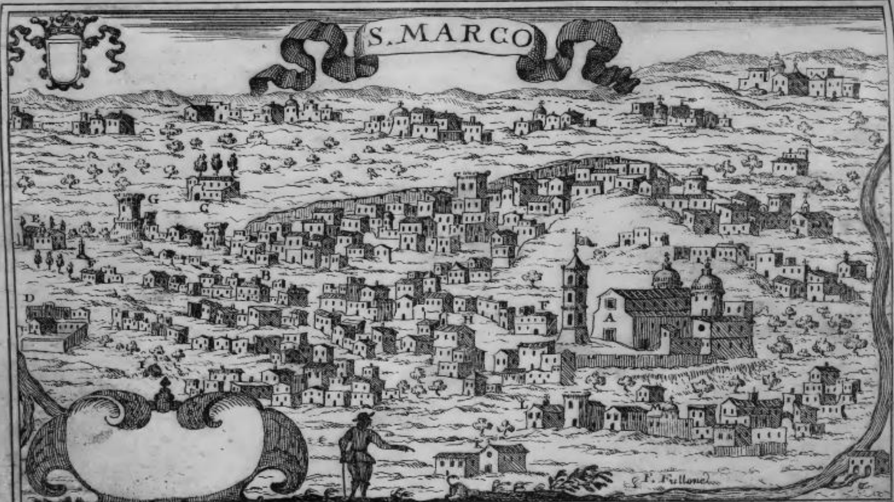
A. Vescovato. B. Palazzo Ducale. C. S. Francesco di Paula. D. Abbazia della Mattina. E. Reformati. F. Serranari. G. Casello. H. S. Caterina. I. Grotta di S. Pietro. K. S. Maria de loco Santo. L. S. M. de Longobar di. M. S. Lorenzo.